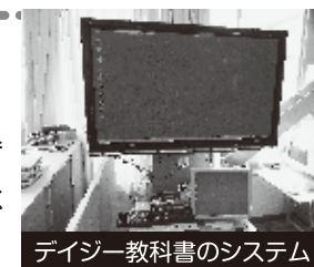
デージー教科書のシステム