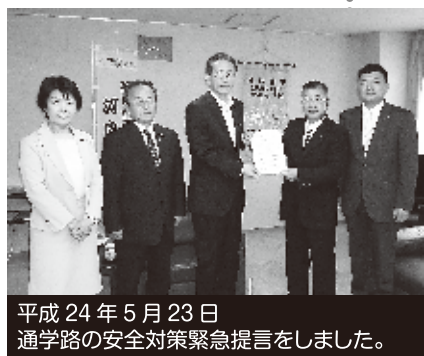
平成 24 年 5 月 23 日 通学路の安全対策緊急提言をしました。

国でも公明党の主張が反映され、通学路の安全対策費用が確保されています。 (問い合わせ ☎53-1111 教育総務課)